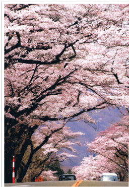
作品名：桜街道