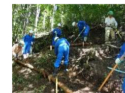
子供でも登れるようになららかに遊歩道を決定します。

その活動の一例として新川流域では、宮城県と「わたしたちの森づくり事業の実施」で、平成28年から協定を結び、水源の継続的な環境保全のための活動を実施しています。具体的には、蒸溜所より上流域にある奥新川地区の森林の「遊歩道の整備」や「森林の下草刈り」などを実施しています。この活動は、環境づくりを行うとともに、森林体験を通じて、森林保全及び自然保護の啓発に貢献することを主な目的としています。現在、森林は整備継続中ですが、この活動を通じて、社員ボランティアやその家族などと、森林レクリエーションなどができるといいと考えています。将来を担う地元の子供たちにも、自然環境の大切さや森林のある自然を愛する気持ちを伝えていきたいと願っています。