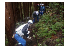
整地をして踏み固めて行きます。この繰り返して山の尾根を目指しています。