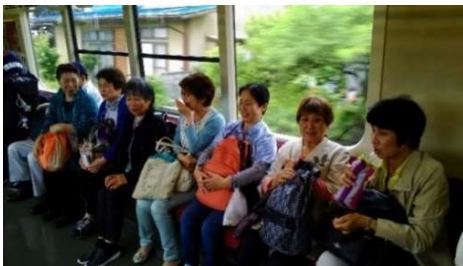
車内の会話ははずみず