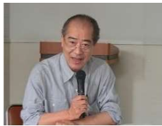
コメントーター:平川新会長(宮城学院女子大学学長)